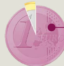
Illustration Münze: iStock.com